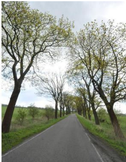
Die Straße ist von etwa 1000 Bäumen gesäumt.

Daraufhin hatte das Bau- und Ordnungsamt einen öffentlich bestellten und vereidigten Sachverständigen mit einer erneuten Begutachtung der 39 betroffenen Bäume beauftragt. Es widersprach in einigen Punkten der vorherigen Baumbegutachtung. Am Ende blieben nur noch 19 Bäume übrig, die gefällt werden müssen.