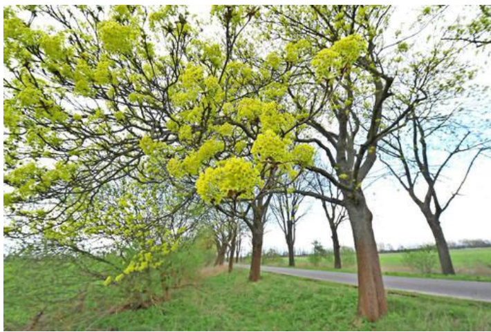
Blüten an der Linumhorster Straße.